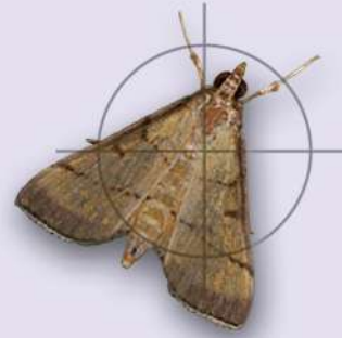
කොළ හකුළන දළඹුවා