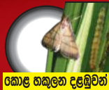
කොළ හකුලන දළඹුවන්