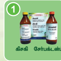
1 கிசகி சேர்ப்க்டன்ட்